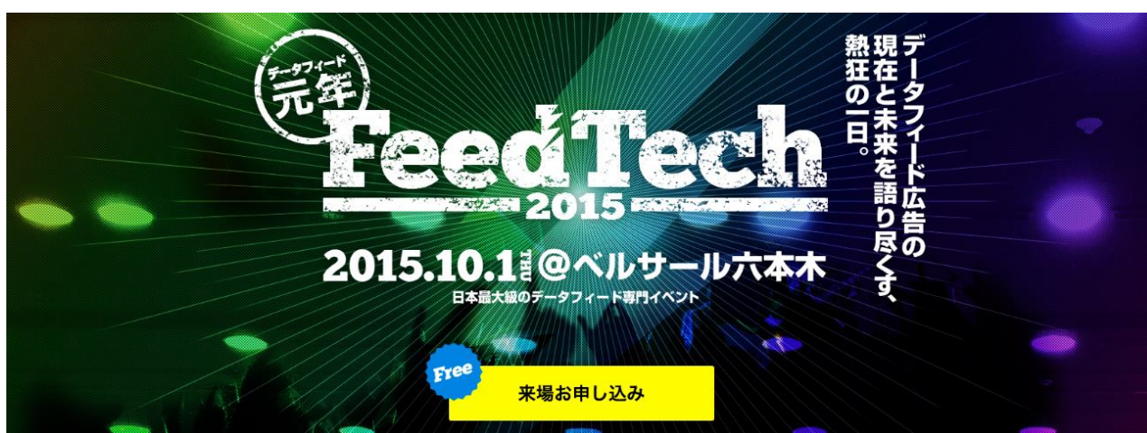
図1 FeedTech 2015 “データフィード元年” 特設サイトイメージ

事前申し込みの受付は2015年8月19日より、特設サイト( https://feedtech.net )にて開始いたします。