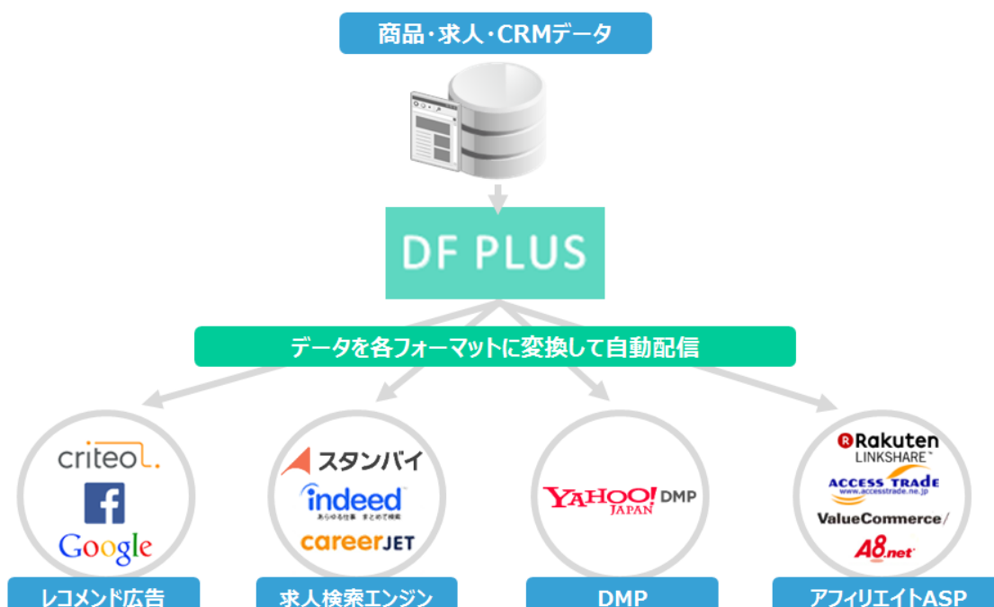
図 3 DF PLUS による CRM データ、商品データの変換・最適化イメージ

ECサイトはもちろんのこと、人材・不動産・旅行業界等の「更新頻度が高く、多くの商材データを取り扱う企業」に対し、データフィードを効果的に運用可能にすることによって、売上向上に貢献します。